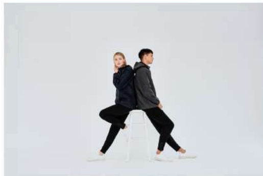
Riley Studio trousers RILEY STUDIO

Dressing comfortably yet stylishly for travel is always a challenge, especially when flying. Riley Studio is a new sustainable lounge wear brand that features a range that works really well for travel. The fabrics are made from upcycled waste products like ocean plastic and fishing nets plus natural fibres. They're made to last a lifetime, not just for one season, so you can see and feel the quality in their garments. The super soft track pants, which come in black or red, are ideal for a long-haul flight and they're unisex. Made from Q-NOVA® by Fulgar recycled nylon, these track pants are created using yarn discards from Fulgar's production cycle, which normally would have been thrown away. The zips at each ankle, plus the weight and feel of the fabric make for a loungewear rather than leisurewear look and a travel wardrobe staple.