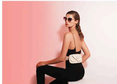
Neon Hope sunglasses come with gold chain and leather case NEON HOPE

I write about travel, food, culture and fashion.